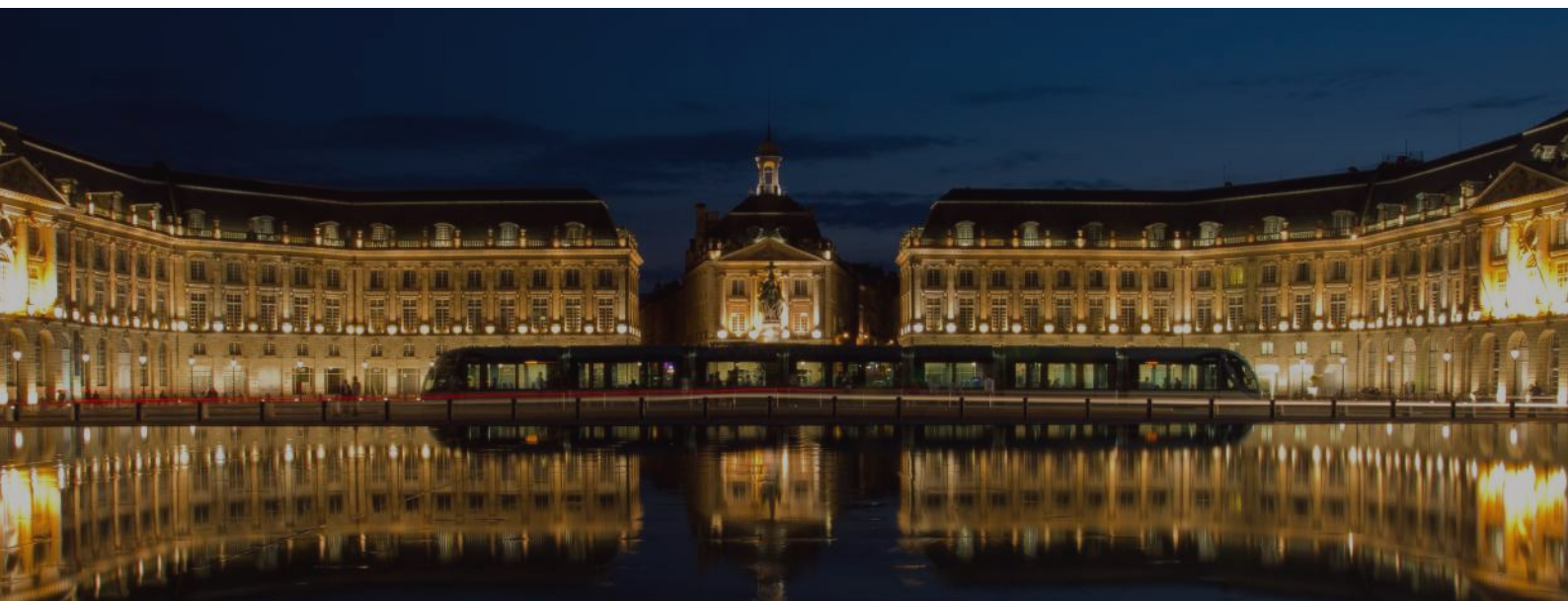
Visite libre de Bordeaux à pied ou en tramway !