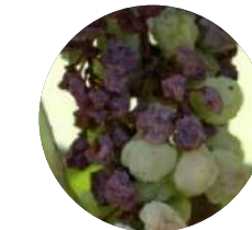
Dépérissements et/ou flétrissement des grappes