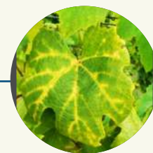
Coloration sectorielle entre les nervures