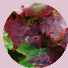
Coloration sectorielle sur nervure